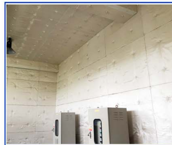
機房消音-玻璃棉板外加玻纖布